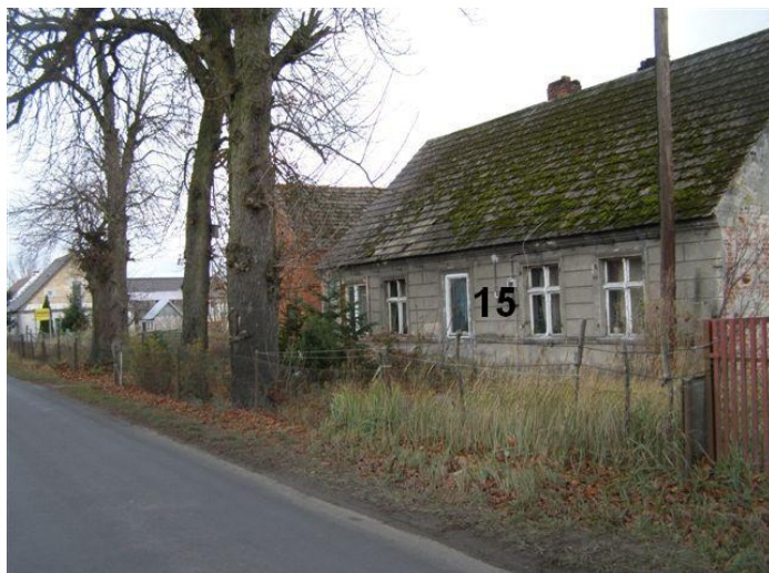
48. Działki nr 76/1 – 71/2, ul. Szkolna posesja 1 - cokół betonowy, słupki betonowe, siatka ogrodzeniowa