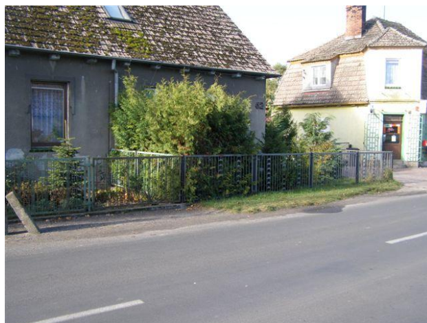
15. Działki nr 103/1 -103/2 posesja 41 - słupki metalowe, siatka ogrodzeniowa