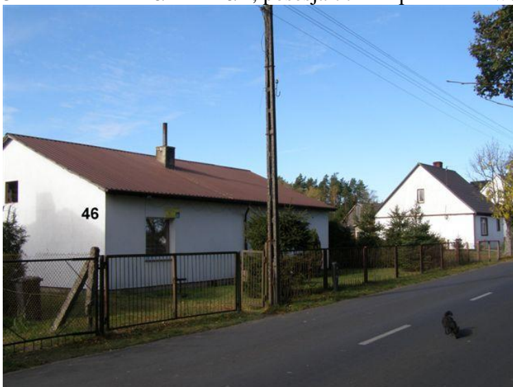
33. Działki nr 127/5 – 127/6, posesja 79 - cokół betonowy, słupki betonowe, siatka ogrodzeniowa