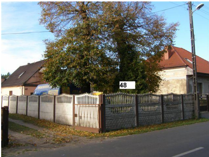
31. Działki nr 125/1 – 125/2, posesja 75- cokół betonowy, słupki metalowe, ramka metalowa