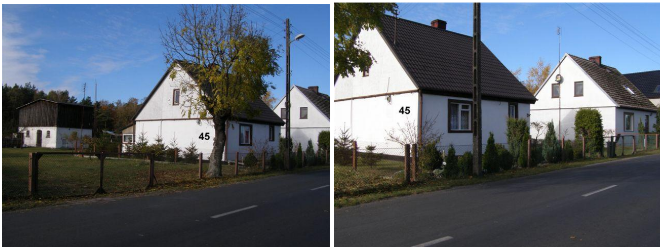
34. Działki nr 128/1 – 128/2, posesja 81 - cokół betonowy, słupki betonowe, siatka ogrodzeniowa w ramce z kątowników