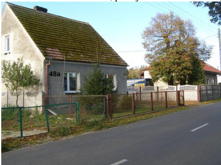
30. Działki nr 124/1 – 124/2, posesja 73 - słupki betonowe, wypełnienie z płyt betonowych prefabrykowanych