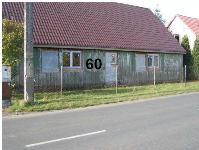
16. Działki nr 105/1 – 105/2 posesja 43 - słupki metalowe, siatka ogrodzeniowa w ramce z kątowników