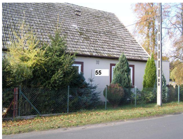
21. Działki nr 112/7 – 112/8 - słupki murowane z cegły klinkierowej