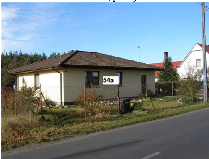
23. Działki nr 114/3 – 114/4 i 115/1 – 115/2, posesja 59 - cokół betonowy, słupki metalowe, ramka metalowa